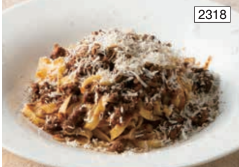
ボロネーゼ Bolognese Spaghetti