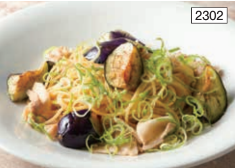
茄子と豚バラの柚子胡椒風味 Eggplant & Pork Belly Spaghetti with Yuzu Koshu Flavor