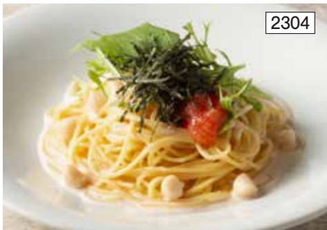
小柱と明太子のクリームソース Cream Sauce Spaghetti with Small Scallops & Spicy Cod Roe