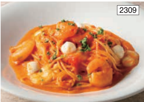
小海老とモッツァレラのトマトクリーム Tomato Cream Sauce Spaghetti with Shrimps & Mozzarella