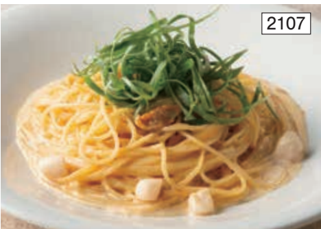
雲丹と小柱のクリームソース Cream Sauce Spaghetti with Sea Urchin & Small Scallops