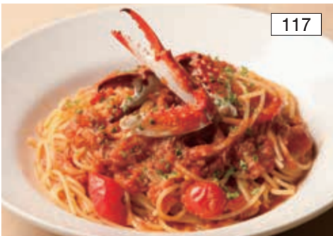
濃厚渡り蟹のトマトソース Tomato Sauce Spaghetti with Blue Crab