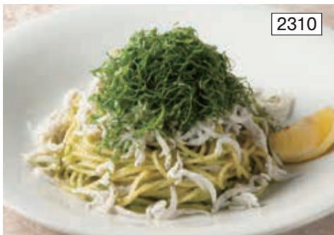
シラスと大葉のジェノベーゼ Genovese Spaghetti with Whitebait & Perilla Leaves