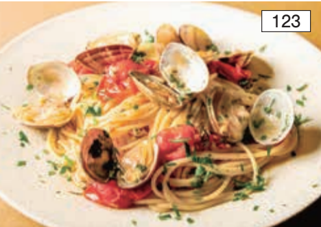
ボンゴレ ビアンコ Vongole Bianco Spaghetti