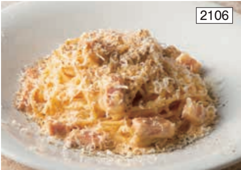
濃厚クリーミーカルボナーラ Creamy Carbonara Spaghetti