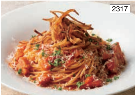
淡路島産玉ねぎのアマトリチャーナ Amatriciana Spaghetti with Onions