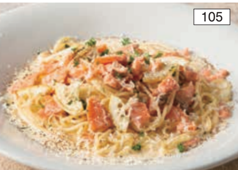
スモークサーモントラウトとレモンの クリームソース Cream Sauce Spaghetti with Smoked Salmon Trout & Lemon