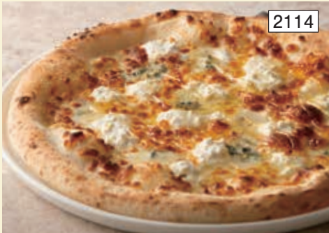
クワトロフォルマッジ Quattro Formaggi