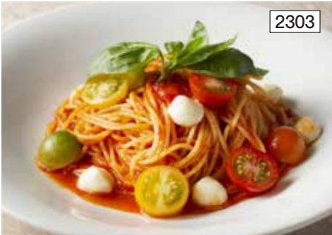
カラフルトマトとモッツァレラのポモドーロ Pomodoro Spaghetti with Colorful Tomatoes & Mozzarella