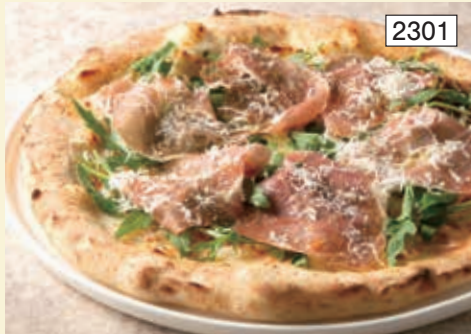
生ハムとルッコラ Prosciutto & Rucola