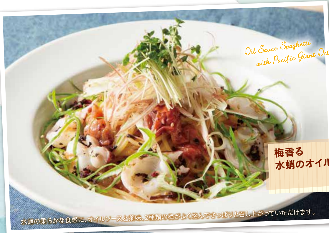
Oil Sauce Spaghetti with Pacific Giant Octopus, Plum Flavored

この夏のおすすめ! 社内コンテストで優勝したパスタとピッツァです。ぜひお召し上がりください。