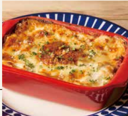
ミートラザニア 1,490(税込1,639)