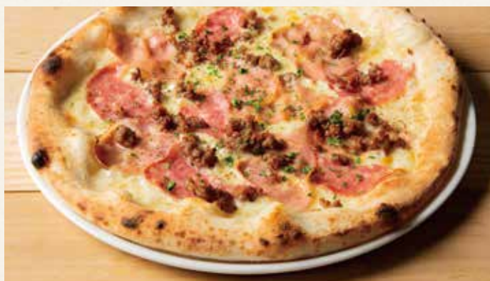
サルシッチャとイタリアンサラミ