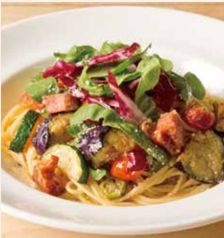
● 野菜とベーコンのペペロンチーノ 1,390(税込1,529)