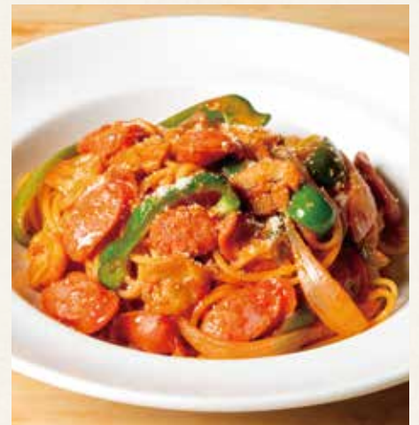
● ナポリタン 1,390(税込1,529)