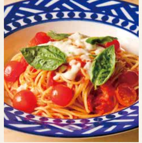
● チェリートマトとモッツアレッタチーズ 1,390(税込1,529)