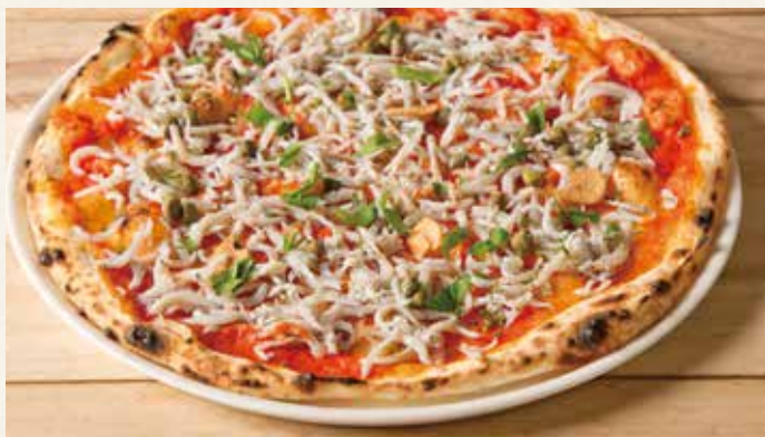
しらすガーリック

ドリンクバー プラス 290(税込319) / ドリンク & デザートバー プラス 390(税込429)