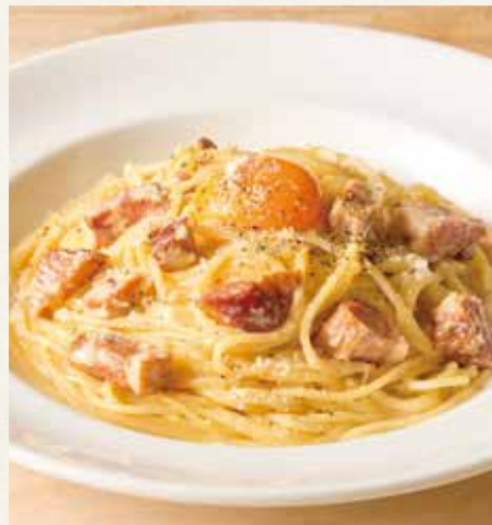
● 厚切りベーコンのカルボナーラ 1,390(税込1,529)