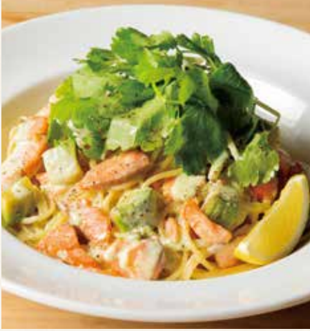
● スモークサーモントラウトとアボカドの クリームソース 1,590(税込1,749)

ドリンクバー プラス 290(税込319) / ドリンク & デザートバー プラス 390(税込429)