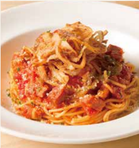
● あめ色玉ねぎのアマトリチャーナ 1,390(税込1,529)