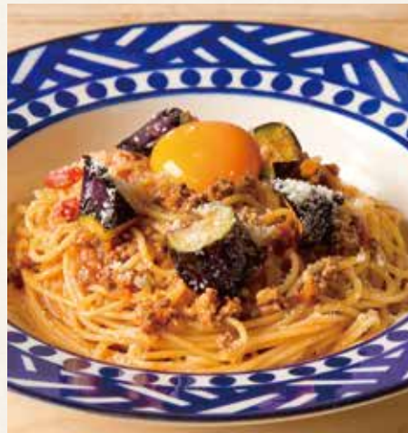
● 茄子のミートソース 1,390(税込1,529)