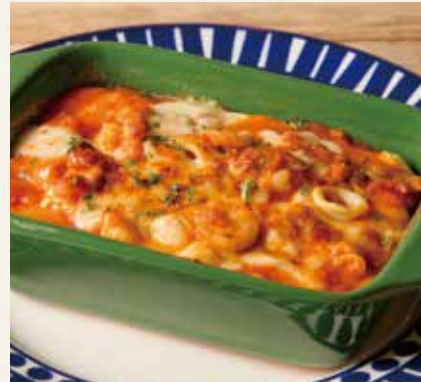
シーフードドリア 1,490(税込1,639)