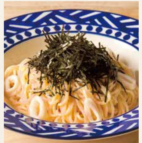
● 明太子クリーム 1,290(税込1,419)