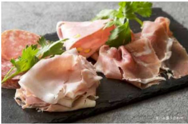
生ハム盛り合わせ