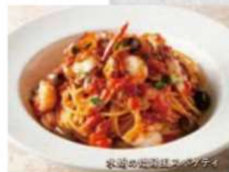
水蛸の娼婦風スパゲティ