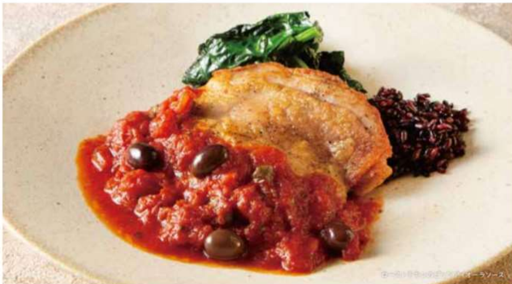
ローストチキンのピッツァイオーラソース