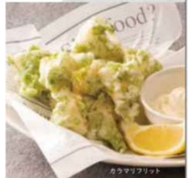
カラマリフリット