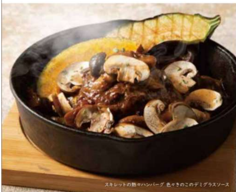
スキレットの熱々ハンバーグ 色々きのこのデミグラスソース

厚切りした牛タンを柔らかくなるまでじっくりコトコト煮込みました。 トロっとした食感と旨みたっぷりのソースをお楽しみください。