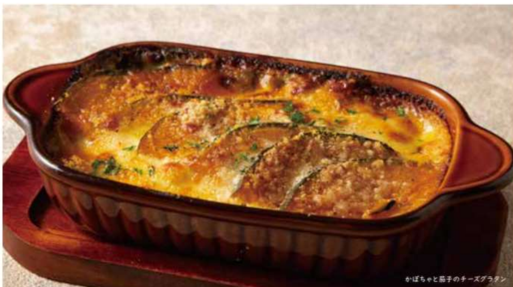
かぼちゃと茄子のチーズグラタン

トマトの酸味とブラックオリーブの塩味が絶妙な「ピザ職人風」のソースです。ハード系のパンにソースをのせてブルスケッタに!