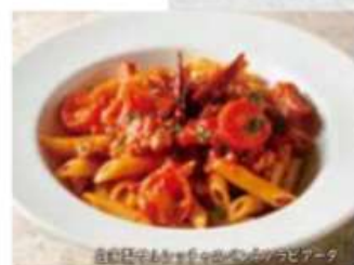
自家製サルシッチャのペンネアラビアータ