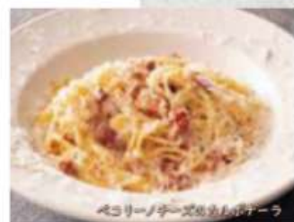
ペコリーノチーズのカルボナーラ