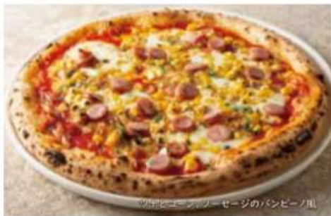
ツナとコーン、ソーセージのパンピーノ風