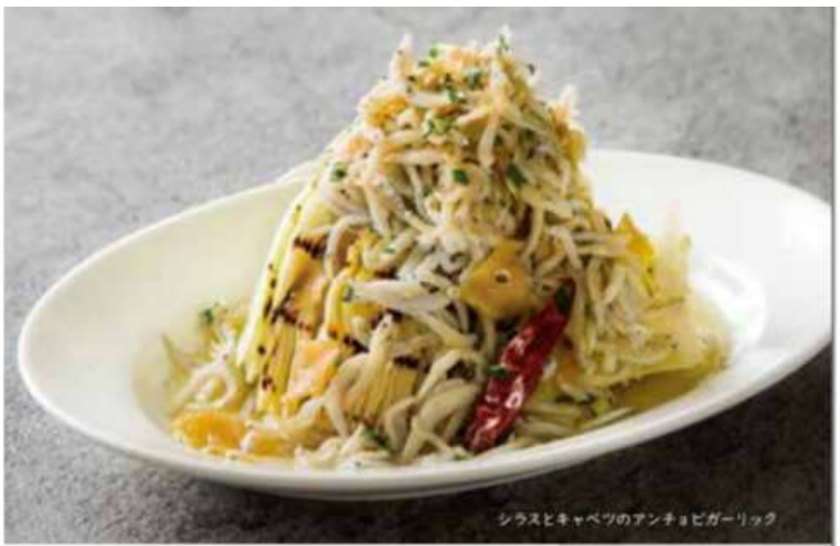
シラスとキャベツのアンチョビガーリック