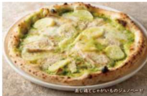
蒸し鶏とじゃがいものジェノベーゼ