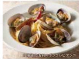
北海道産浅利のボンゴレピアンコ