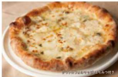
クワトロフォルマッジ はちみつ付き