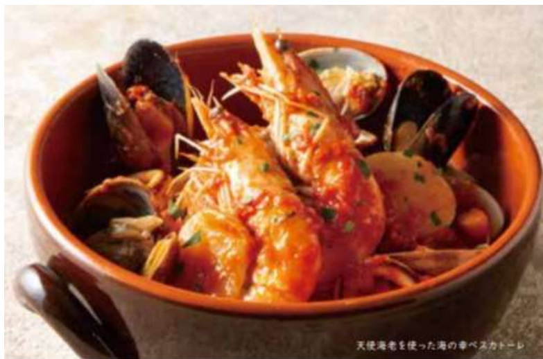
天使海老を使った海の幸ペスカトーレ