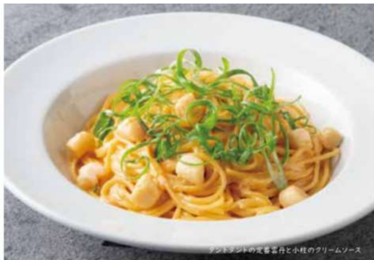
タントタントの定番雲丹と小柱のクリームソース