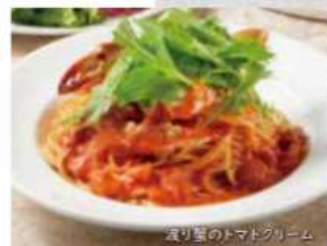
渡り蟹のトマトクリーム