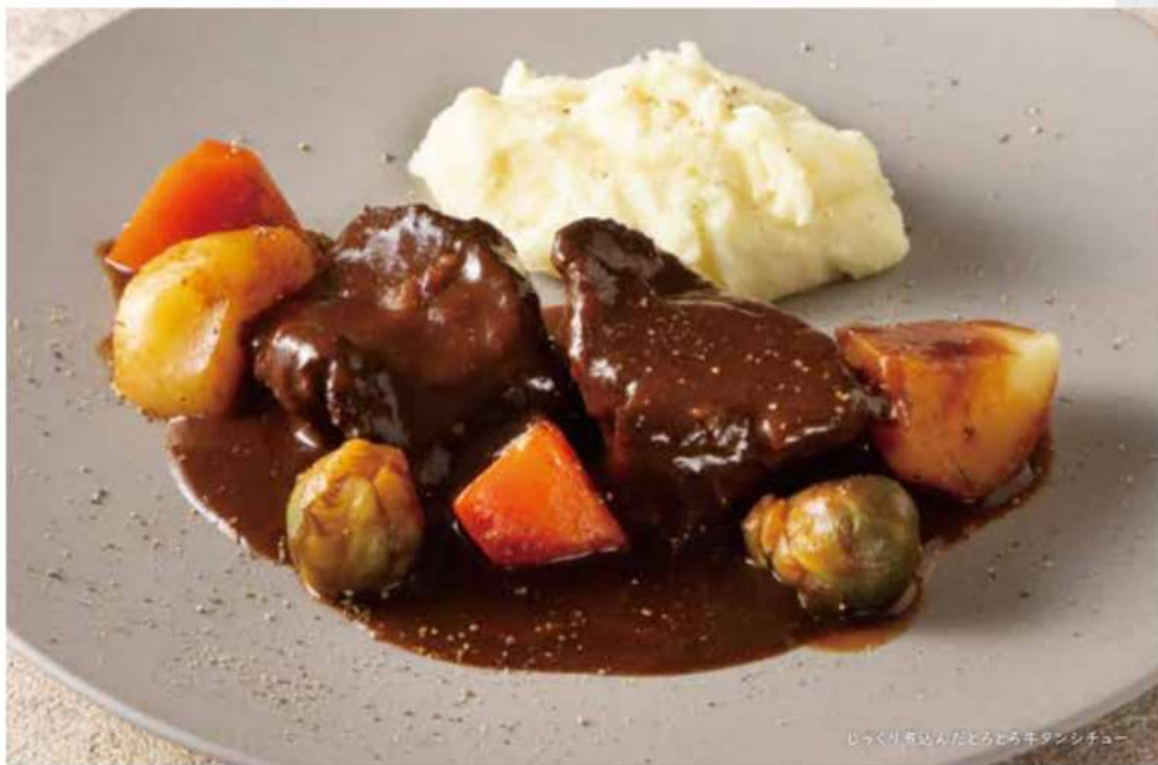
じっくり煮込んだとろとろ牛タンシチュー