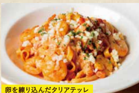
卵を練り込んだタリアテッレ

〈前菜バー&サラダバー付き〉 1,790 (税込1,969) 〈単品〉 1,690 (税込1,859)