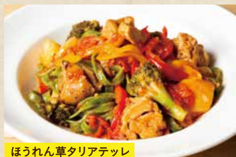
ほうれん草タリアテッレ

〈前菜バー&サラダバー付き〉 1,790 (税込1,969) 〈単品〉 1,690 (税込1,859)