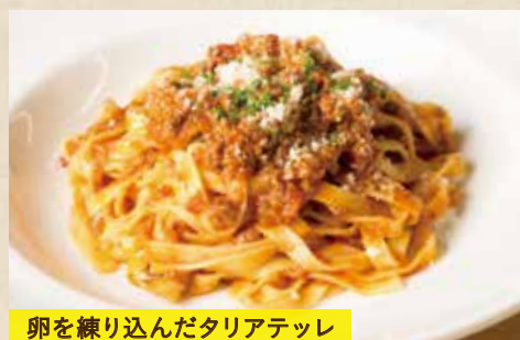
卵を練り込んだタリアテッレ