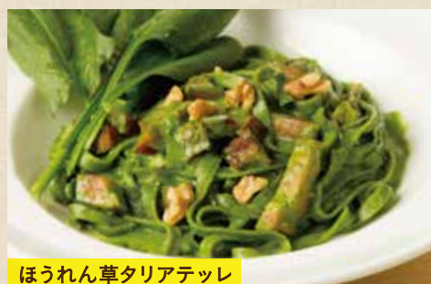
ほうれん草タリアテッレ

〈前菜バー&サラダバー付き〉 1,790 (税込1,969) 〈単品〉 1,690 (税込1,859)