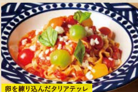
卵を練り込んだタリアテッレ

〈前菜バー&サラダバー付き〉 1,790 (税込1,969) 〈単品〉 1,690 (税込1,859)