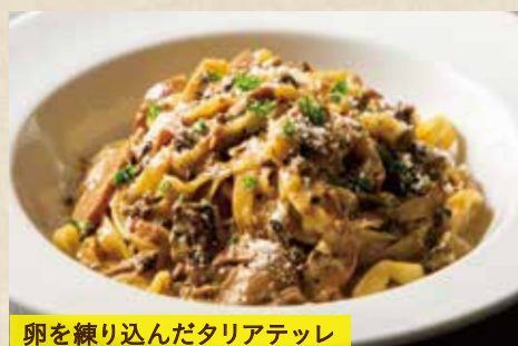
卵を練り込んだタリアテッレ

〈前菜バー&サラダバー付き〉 1,890 (税込2,079) 〈単品〉 1,790 (税込1,969)