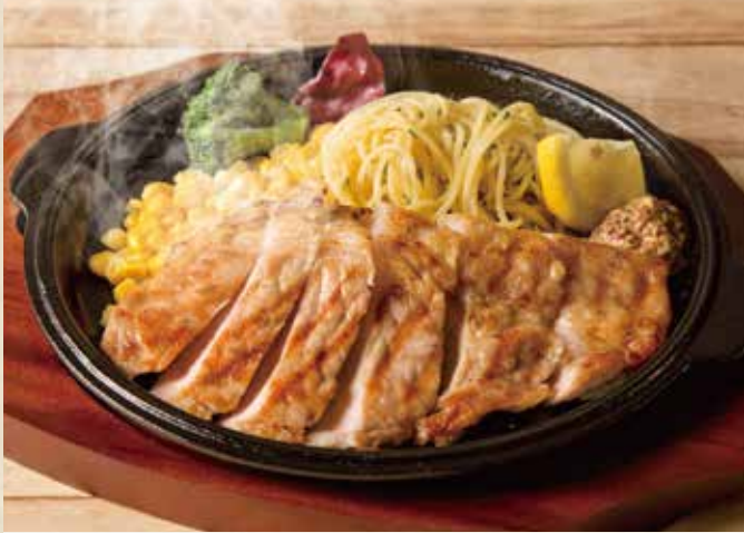
茶美豚のグリルステーキ

ワイン & ソフトドリンクバー お食事 プラス 390 (税込429) 単品 490 (税込539)