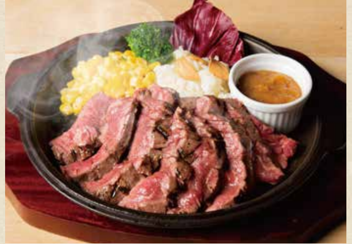
牛ハラミのグリルステーキ