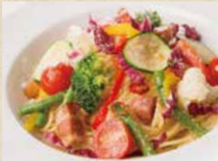
野菜とベーコンの菜園風 990+税