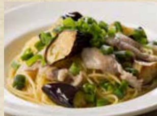
茄子と豚肉の柚子胡椒ソース 1,190+税