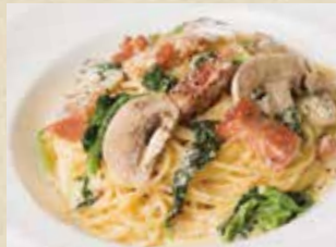
野菜とマッシュルームの カルボナーラ 1,190+税