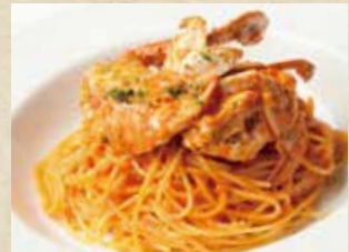
渡り蟹のトマトクリーム 1,290+税