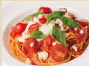
チェリートマトとモッツアレチーズの トマトソース 990+税