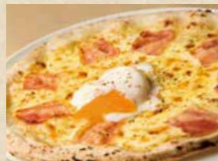
半熟玉子のカルボナーラピッツァ 1,290+税