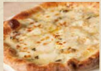
4種チーズのピッツァ 1,290+税