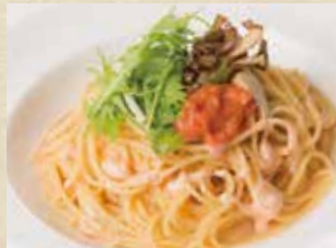
舞茸と水菜の明太子クリーム 1,190+税