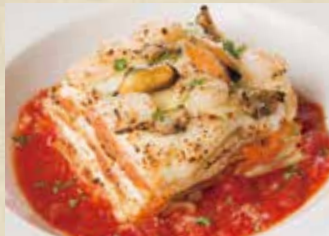
シーフードラザニア 1,290+税