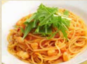
小海老のアラビアータ 990+税