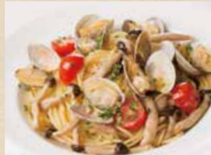
あさりとしめじとチェリートマトの オイルソース 1,190+税