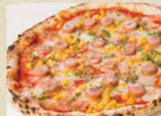
ソーセージとコーンのトマトソース ピッツァ 1,190+税